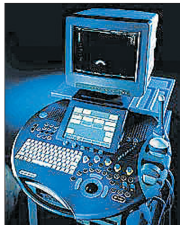
A legújabb fejlesztésű ultrahang készülék

A nyaki verőerek beszűkülése, részleges elzáródása esetenként semmilyen panaszt nem okoz, viszont az agy és